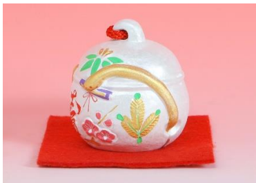
干支の置物：大丸別荘様