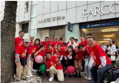
「ロータリー奉仕デーポリオ募金活動」