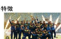
スリランカのクリケット