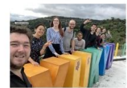
沖縄への修学旅行