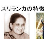
世界的な女性選抜