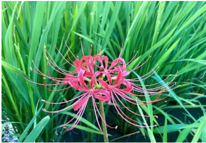
「小さな秋見つけた」