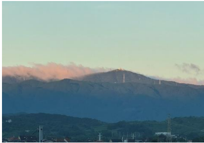
「背振山の陽雲」