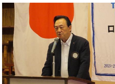
* 委員会開催報告 7月18日 於:吉丁 50名を目標に! 入会の入口を大切に考える