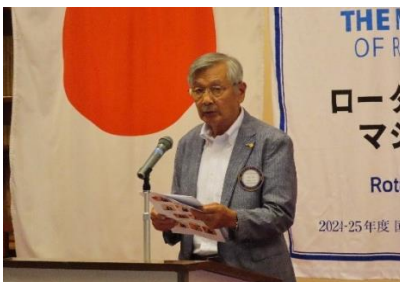
* 地区委員会出席報告 豊かな自然プロジェクト 10クラブ決定