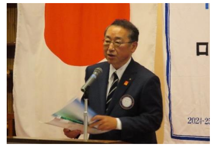
* 黒川先生の卓話について * 福岡城西RC60周年記念誌の件 奈良大宮RC45周年記念誌の件