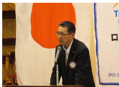
* 状況報告と協賛のお願い