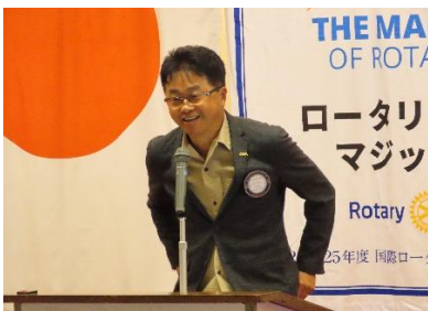
* 春日炉辺会合開催のお知らせ 7月23日18:30 於:桃花園