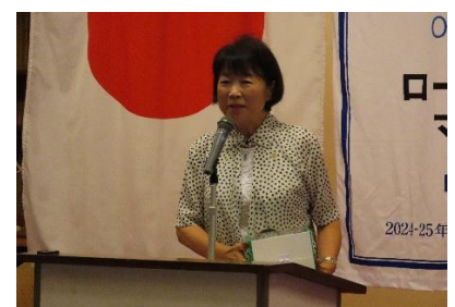
* 財団補助金PJ・ポリオ担当 本日卓話について ポリオ寄付のお願い