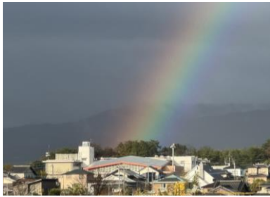
【春日東小学校に虹と朝日】