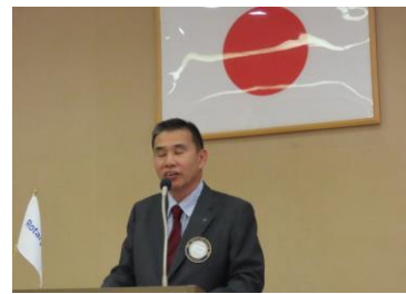
☆昨年のロータリー行事 年末年始の出来事について