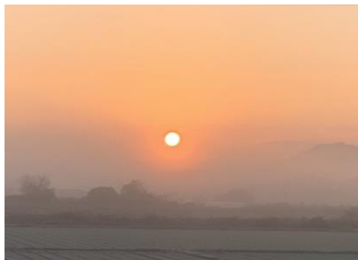
【花立山穴観音古墳に浮かぶ朝日】