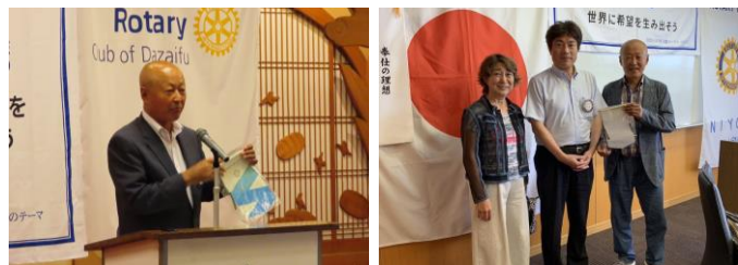
仁淀RCメークアップ訪問バナー交換報告