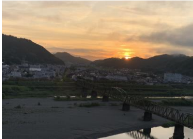
【仁淀川の鉄橋と朝日】