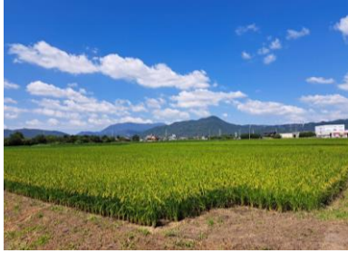
【筑前町の初秋】

2023～24 年度 国際ロータリーのテーマ RI会長 ゴードン R. マッキナリー