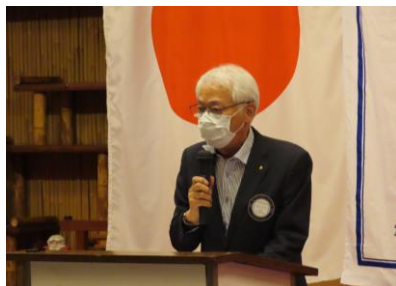
時札正文財団米山委員長 財団・米山委員会開催の件