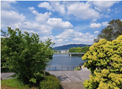
【大野城市の三兼池】