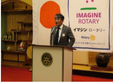
会員拡大のお願い 会員加入資料の件