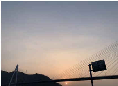
【しまなみ街道因島の朝日】

2022～23 年度 国際ロータリーのテーマ RI 会長 ジェニファー・ジョーンズ