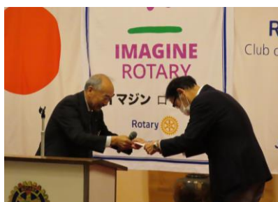
三條カウンセラー委嘱状伝達