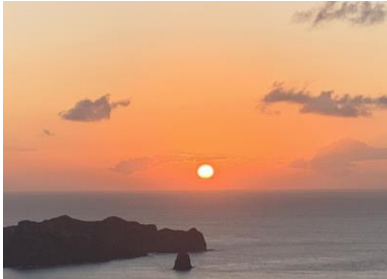
【小笠原村最高峰中央山の朝日】