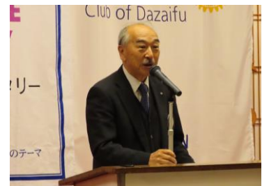
バレンタインデー今昔 米山奨学生ザヤさんの件 曲水の宴の件・地区大会の件