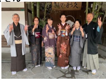
ザヤさん近況報告と奨学金授与 ザヤさんを和服で送る会 2月12日