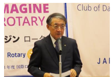
インターシティミーティングご案内