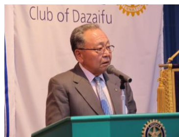
2021-22年度会長幹事の集い報告