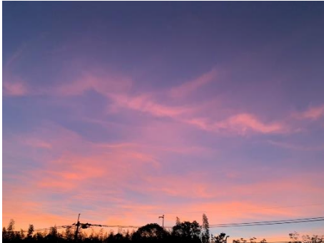
【我が街 春日の朝焼け】