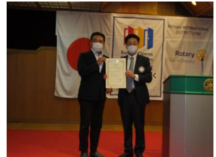
田村委員長より表彰状贈呈