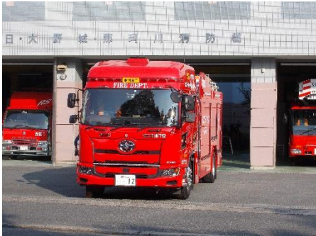
【春日・大野城・那珂川消防署】