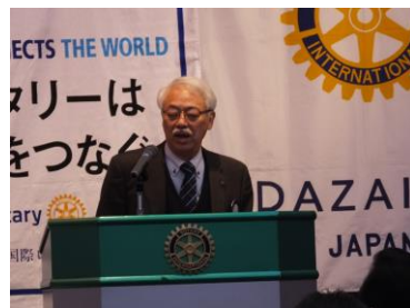
時札正文直前会長