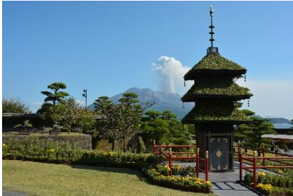
【写楽の会鹿児島旅行 仙巖園】