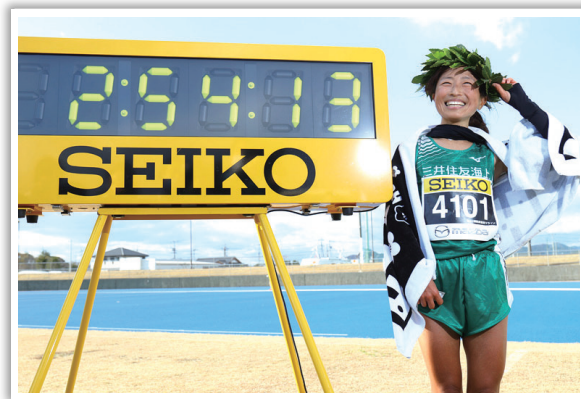
2020年12月20日 防府読売マラソン視覚障がい女子 2時間54分13秒の 世界新記録をマークして優勝！